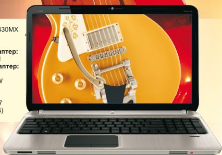
HP Pavilion dv6-6c02er

Процессор: AMD A6-3430MX Память: 4 Гб/ DDR3 Жесткий диск: 320 Гб Дискретный видеоадаптер: AMD Radeon HD 7690M Встроенный видеоадаптер: AMD Radeon HD 6520G ОУ: DVD±R/RW&CD-RW Веб-камера: 1.3 Мп Размер экрана: 15.6" ОС: Microsoft Windows 7 Домашняя базовая (x64)