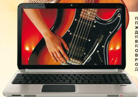
HP Pavilion dv6-6c09er